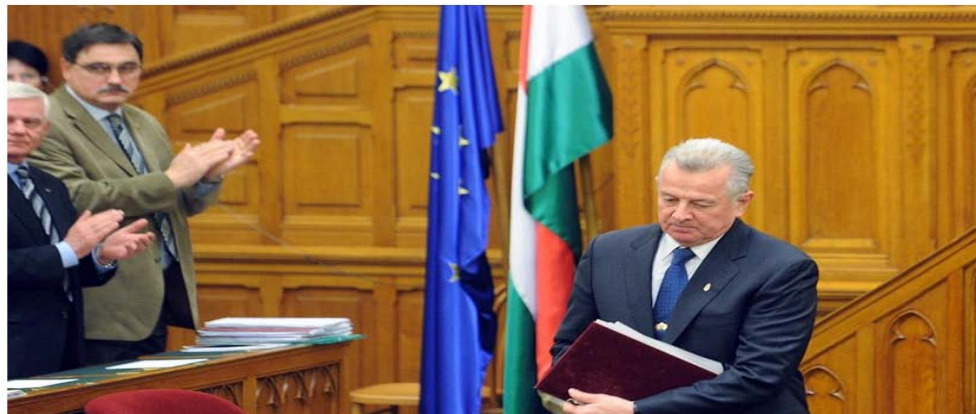
El presidente húngaro Pal Schmitt en el Parlamento de Budapest el día de su dimisión en abril de 2012.