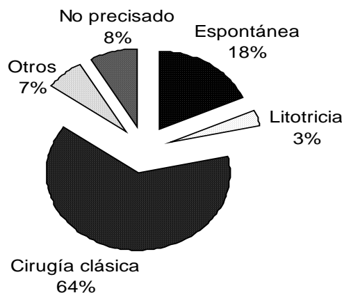
Figura 1. Modos de eliminación de cálculos urinarios de pacientes que acudieron al IICS, Paraguay 2007.

El 48% de los pacientes (n=24) eliminó múltiples cálculos, variando de 2 hasta 50 elementos o fragmentos por individuo y en 6% (n=3) se examinó material amorfo, no pudiendo identificar el número de elementos.