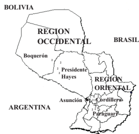
Figura 1. Origen geográfico de los ejemplares de Triatoma infestans empleados en el análisis isoenzimático. Las cruces indican las localidades estudiadas en cada departamento.

De los sistemas estudiados sólo se encontró diferencias entre ambas poblaciones de triatominos en el sistema alfa GDP, en el cual se obtuvieron dos fenotipos: el fenotipo 1 con tres bandas y el fenotipo 2 con una sola (figura 2). El fenotipo 1 de este sistema se observó en el 86,36% de los 44 ejemplares provenientes de la región Oriental y Occidental, en tanto que el fenotipo 2 se observó sólo en el 13,63%, todos pertenecientes al Chaco, tanto en Boquerón como en Presidente Hayes, aunque en mayor proporción en este último (5 de los 12 examinados de ese departamento). En los otros sistemas se obtuvieron los mismos perfiles de bandas en todos los ejemplares, lo que indica una baja variabilidad. En los sistemas MDH e IDH se observaron dos bandas pertenecientes a dos loci separados. En los demás sistemas (PGM, GPI, y 6PGD) se obtuvo una sola banda. Los ejemplares de la región oriental resultaron todos iguales, sin encontrarse diferencias entre poblaciones domiciliarias y peridomiciliarias. Como ya se ha descrito previamente los perfiles de isoenzimas no revelaron diferencias entre hembras y machos.